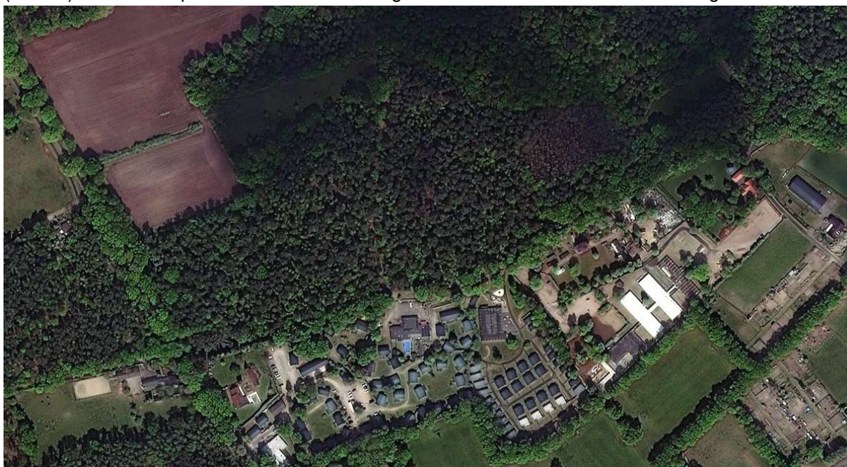
Mei 2022 (aan de noordzijde van het Landgoed zijn de lichtgroene esdoorns nog zichtbaar)

Gebleken is dat er op het perceel kadastraal bekend Gemeente Haalen, sectie A, nr. 4554 bomen zijn geveld. Uit kaart-, luchtfoto en veldonderzoek is gebleken dat het bij gaat om een velling van (noorse) esdoorns. Op onderstaande afbeeldingen is de situatie van voor en na velling zichtbaar.