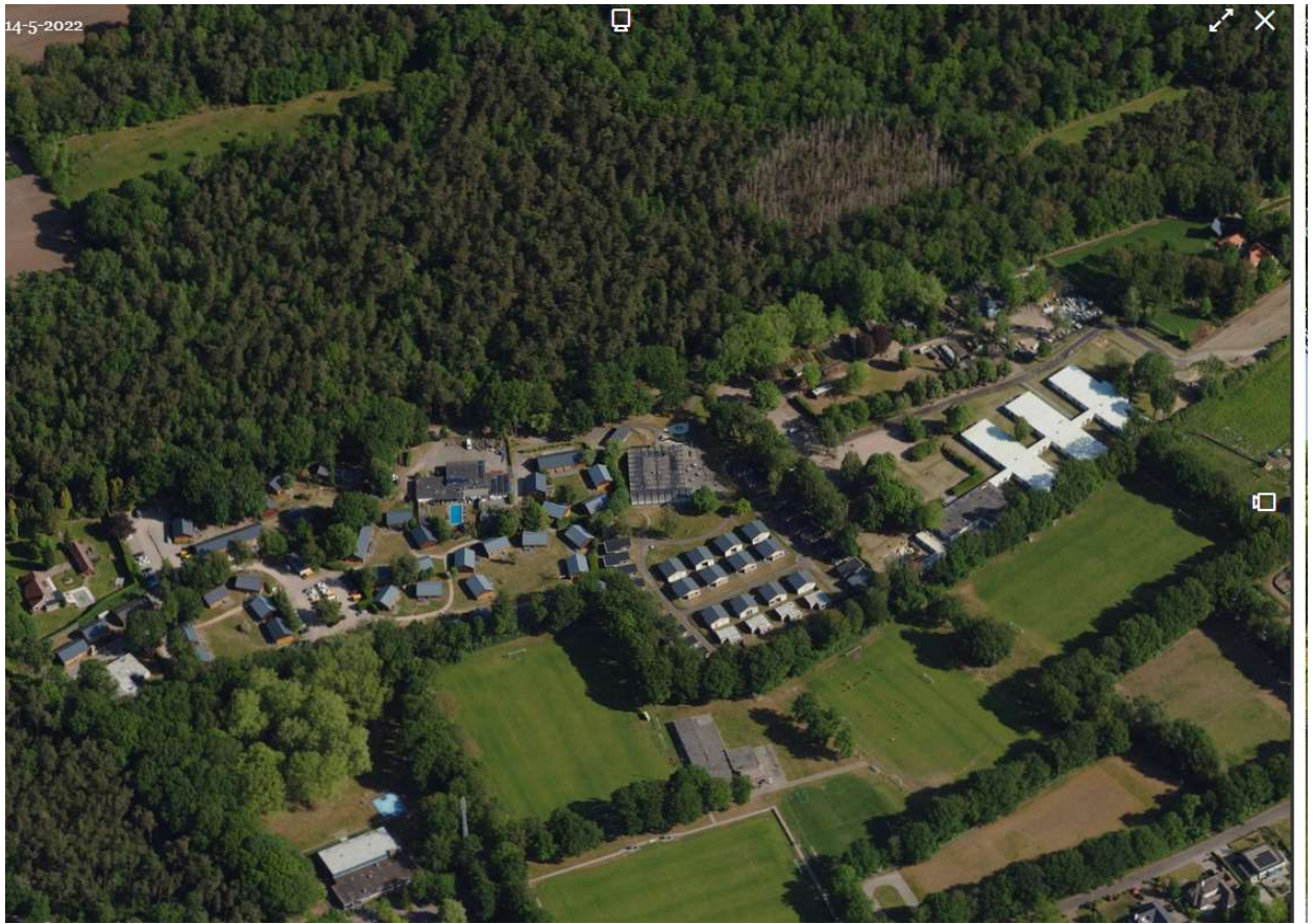
Obliquefoto d.d. 14 mei 2022

Opgemerkt wordt dat er op 5 september 2016 een kapmelding (zie volgende pagina) in het kader van de toenmalige Boswet bij het toenmalig bevoegd gezag RVO werd ingediend door vellingsfirma Peeters uit Kessel. De kapmelding had een geldigheidsduur van één jaar. Er werd toen echter geen gebruik gemaakt van de kapmelding. Nadien werd er echter geen nieuwe kapmelding meer ingediend. Opgemerkt wordt dat in voornoemde kapmelding eveneens melding werd gemaakt van de voorgenomen velling van fijnsparren op een naburig perceel (Gemeente Haelen, sectie A, nrs. 3 t/m 5). Ook voor deze fijnsparren werd geen gebruik gemaakt van de kapmelding uit 2016. Van deze nog aanwezige maar dode fijnsparrenhoutopstand is een separaat controlerapport opgesteld.