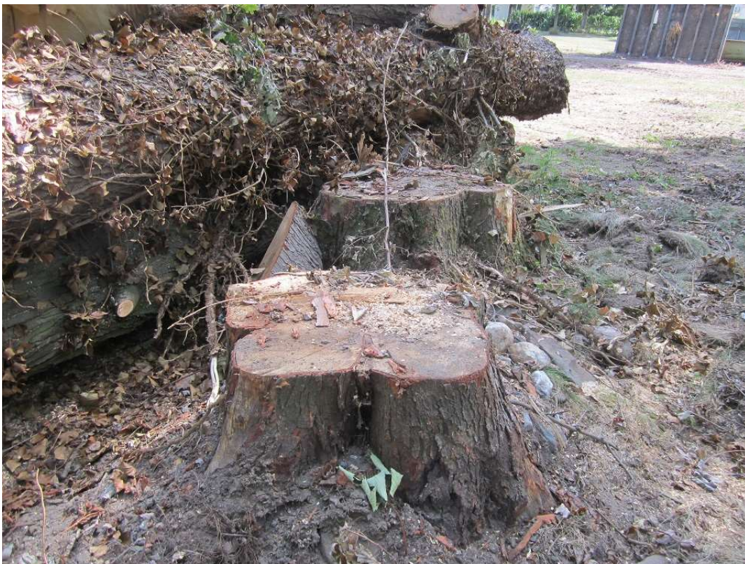
Situatie op 28 juli 2022

Vervolgens heb ik op 13 december 2022 een gesprek gehad met [REDACTED] ([REDACTED] van Landgoed Leudal Vastgoed BV). [REDACTED] deelde mij mede dat er regelmatig takken afbraken van de esdoorns en deelde mij mede in de veronderstelling te zijn correct te hebben gehandeld. [REDACTED]